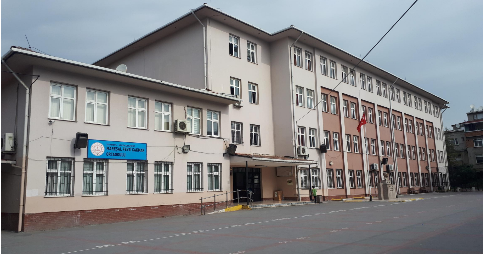
MAREŞAL FEVZİ ÇAKMAK ORTAOKULU